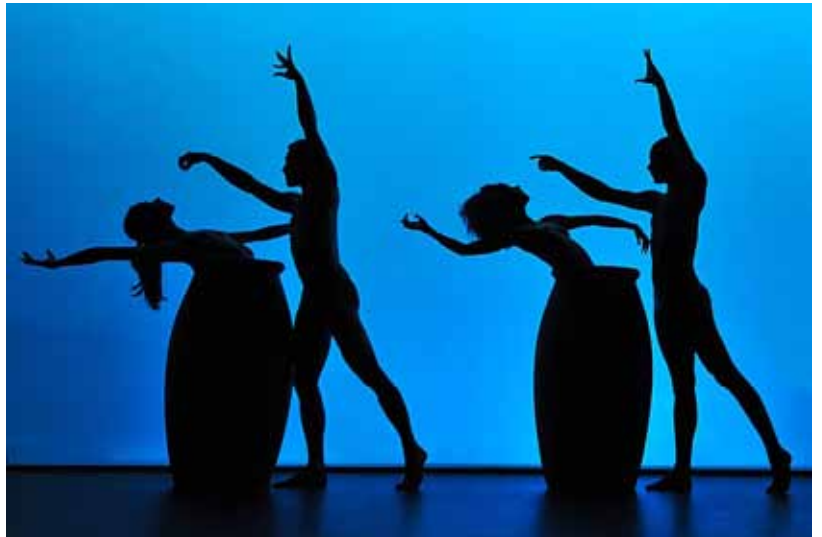
Les Nuits d'Angelin Preljocaj