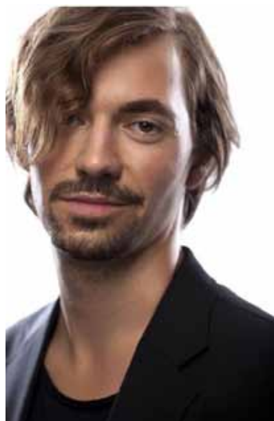
Valer Sabadus