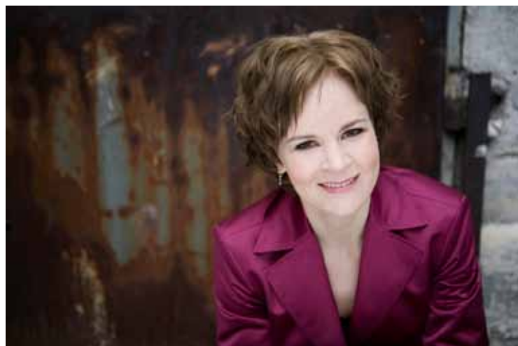
Susanna Mälkki

PAYS États-Unis DATES 27/06 ► 18/08/2013