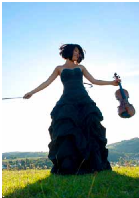
Tianwa Yang

Jyväskylä (Finlande), Œuvres de Vivaldi et Piazzolla, 12 juin ; Schloss Berlepsch (Allemagne), Mendelssohn : Concerto pour violon , 1 er septembre.