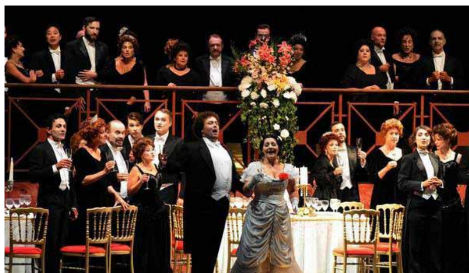
Traviata Sanxay 2012