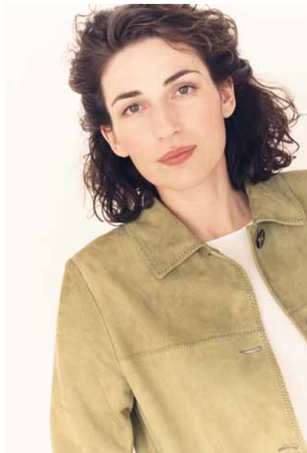
Véronique Gens

PAYS France, Nord-Pas-de-Calais DATES 14/06 ▶ 6/07/2013