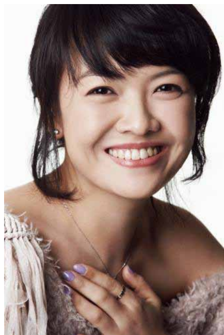
Sunhae Im © Lilac