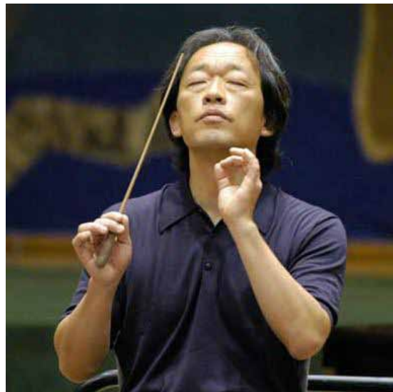
Myung-whun Chung

Du côté de la danse, un gala mettra à l'honneur les grandes écoles et académies de danse européennes : école de ballet de l'Opéra de Paris, académie Vaganova de Saint-Petersbourg, école de danse de Stuttgart ou encore académie du ballet de la Toscane (21 juillet).