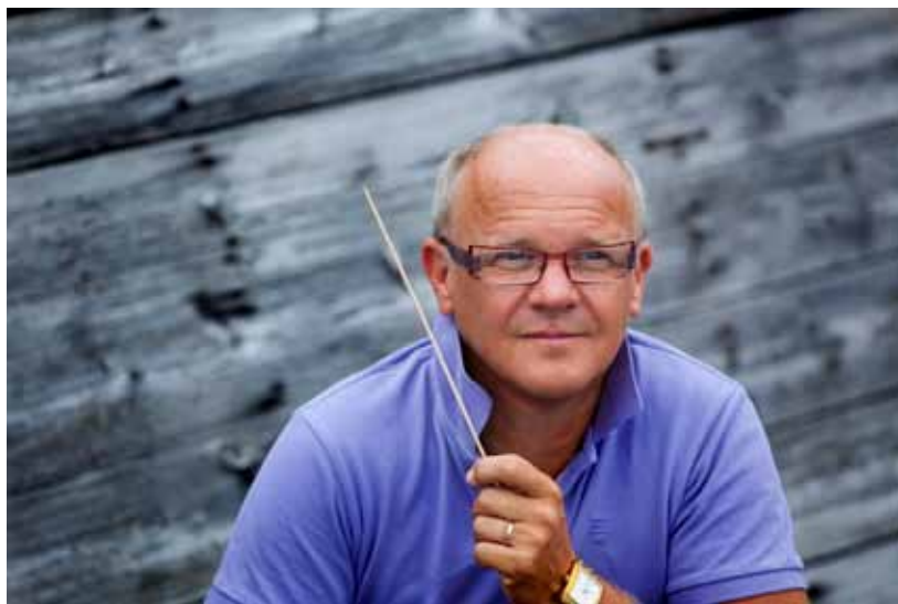
Christian Lindberg