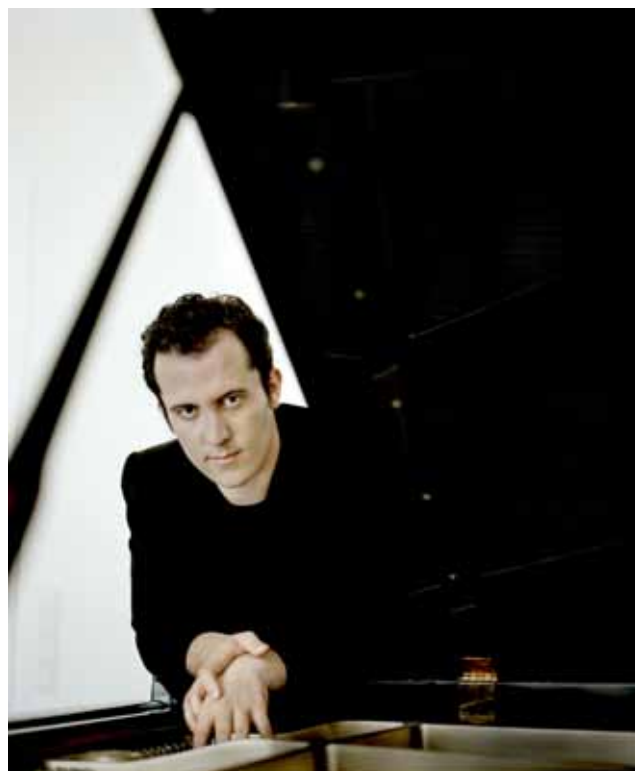
Igor Levit