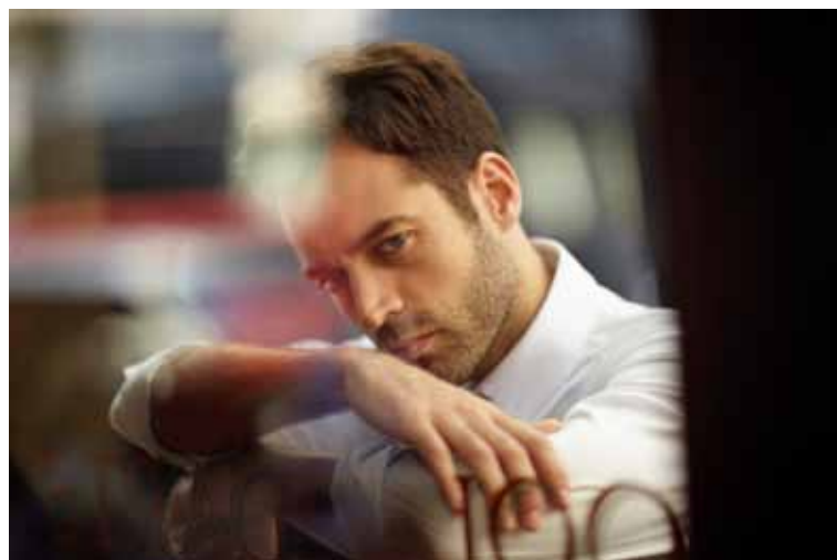
Benjamin Millepied

L'affiche du festival d'Edimbourg 2013 est un parcours à travers les « arts de la scène ».