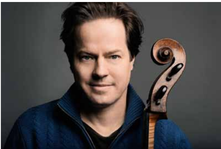
Jan Vogler

L'affiche mixe de grands classiques de la musique de chambre avec des œuvres plus rares : Suite Op.23 d'Erich Wolfgang Korngold et les Quatre saisons d'Astor Piazzolla (16 août), le Quatuor avec soprano d'Arnold Schönberg (18 août) ou les Cinq pièces pour quatuor d'Erwin Schulhoff (25 août).