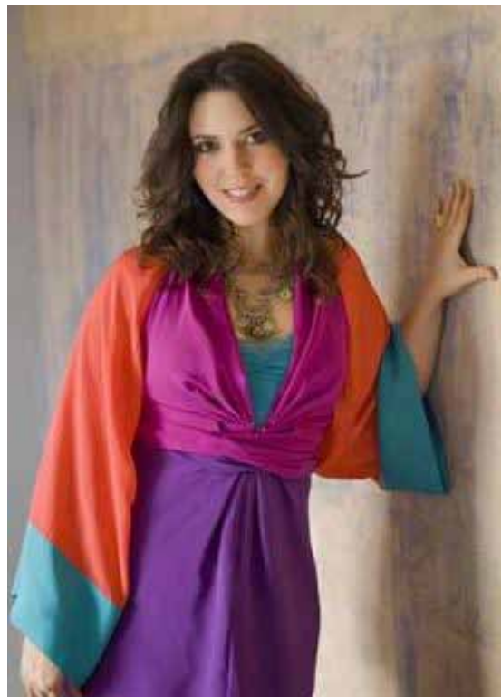
Gabriela Montero

La manifestation n'hésite pas à tisser des liens avec les musiciens amateurs, ainsi deux séminaires sont organisés avec des solistes pour permettre à différents groupes de musiciens non profession- nels d'améliorer leur pratique.