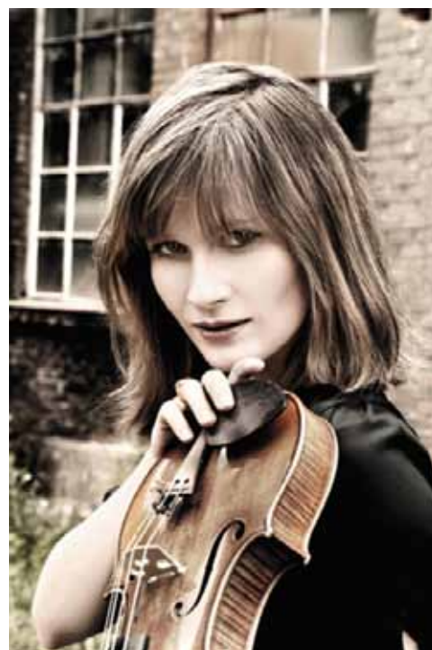
EMPERI Lisa Batiashvili

PAYS France, Provence-Alpes-Côte d'Azur DATES 28/07 ▶ 8/08/2013