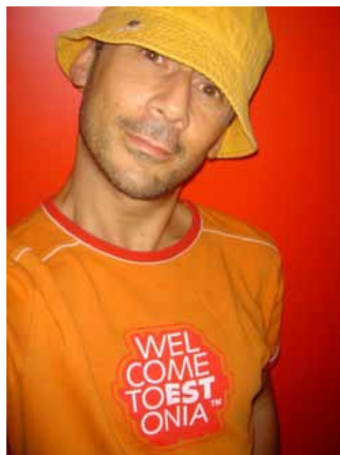
Jérôme Bel

Mais le Festival d'Avignon, ce sont aussi les treize anciens artistes associés, qui passeront pour un jour avec une proposition artistique, lecture, film ou performance, et tisseront un fil de mémoire entre les différentes éditions du festival dirigées depuis dix ans par l'équipe actuelle, qui cédera l'année prochaine la place au dramaturge et metteur en scène Olivier Py.