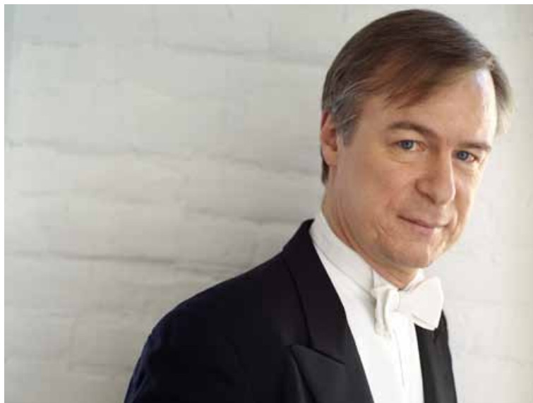
David Robertson

Pierre Boulez sera à la tête des jeunes musiciens sélectionnés pour participer à l'orchestre de l'Académie dans des programmes certifiés XXI e siècle (7 et 9 septembre). Ces talents en devenir seront également mis à contribution pour une fête des 75 ans sous la direction de David Robertson (25 août).