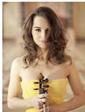
Alina Pogotskina © alinapogotskina.de