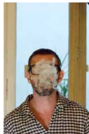
Christian Rizzo

Festival d'Avignon, Christian Rizzo : D'après une histoire vraie , du 7 au 15 juillet.