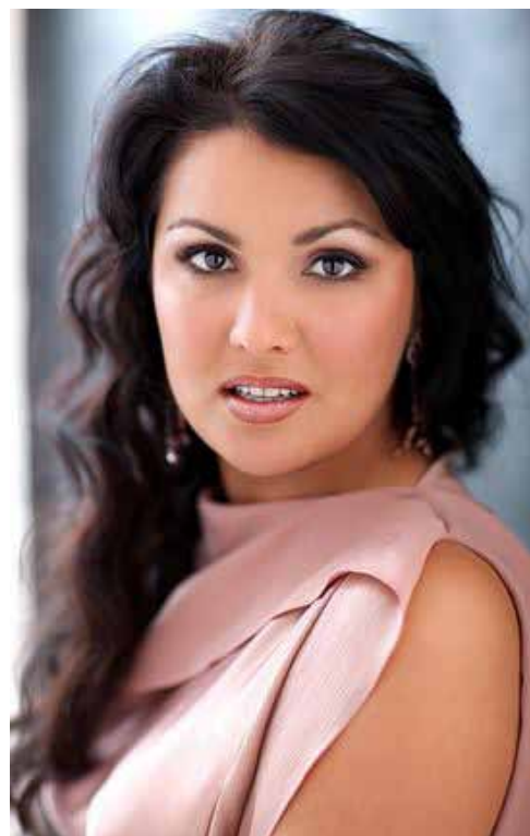
Anna Netrebko

On pourra entendre également le démoniaque Daniil Trifonov, nouvelle étoile du piano russe en récital (28 juillet) et en musique de chambre (28-29 et 31 juillet). Certains événements de cette édition se veulent exceptionnels comme une rencontre de choc Richard Wagner/Giuseppe Verdi dirigée par Valery Gergiev avec une distribution de luxe : Anna Netrebko dans Verdi et Bryn Terfel dans Wagner (25 juillet) ou ce Requiem de Verdi dirigé par Gianandrea Noseda (1 er août). Le festival se complètera, comme chaque année, par des concerts des étudiants de l'académie du festival ou des solistes des orchestres, sans oublier les classes de maître placées sous la caution artistique de grands artistes.