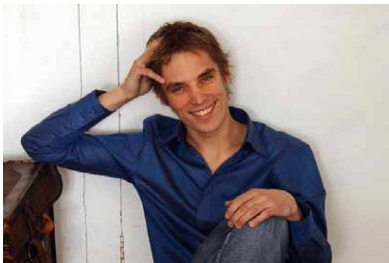
Cédric Tiberghien

A lliant musique et nature, le Festival des Forêts propose des concerts en plein air : pique-niques (bio, bien sûr), goûters, randonnées, ou promenades en forêt ponctuées de concerts, comme par exemple un parcours avec les « Chanteurs d'oiseaux » pour dialoguer avec la nature. Belle musique au parfum de chlorophylle, qui dit mieux ? De plus, ces excursions et concerts (les « Concerts en famille ») sont souvent bien adaptés aux enfants auxquels de nombreux ateliers sont également consacrés. Le patrimoine de Compiègne et de sa région sera aussi mis à l'honneur par des soirées en salles ou dans des églises. Un après-midi entier sera consacré à Schubert dans différentes salles du Château de Pierrefonds, avec un marathon de cinq concerts qui se termineront par une