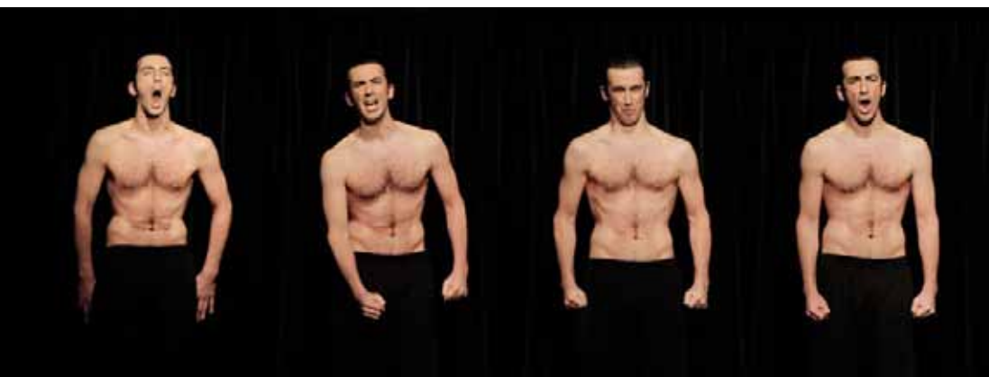
Tour de David Wampach

La poésie sonore, le rapport à la musique et au texte sont les fils tendus entre les pièces de groupes. Charles Pennequin et Anne-James Chaton, poètes sonores, donnent le La du mouvement, l'incitant à se déployer dans les pièces de Vincent Dupont et Sylvain Prunenec. Vision rock, baroque et débridée du paradis et de l'enfer dans Paraíso , la pièce de Marlene Monteiro Freitas qui clôture le festival.