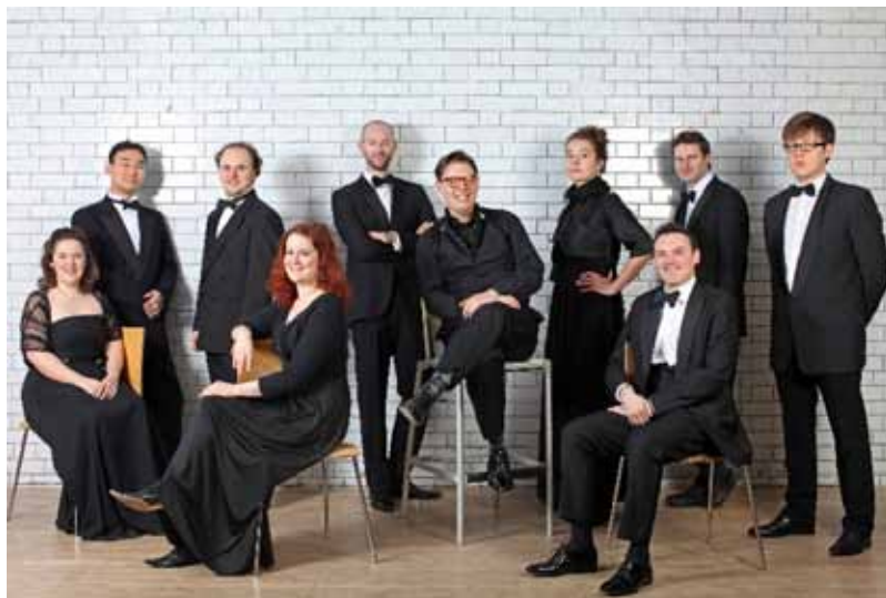
La Nuova Musica