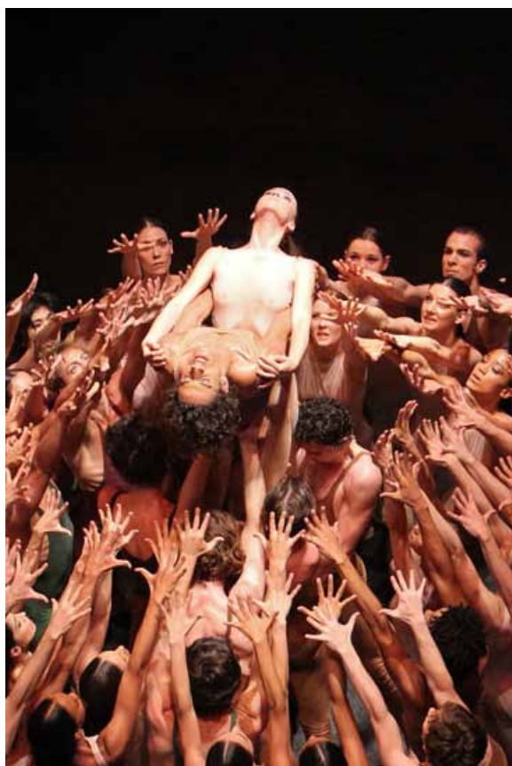
Béjart Ballet Lausanne

PAYS France, Languedoc-Roussillon DATES 19/06 ▶ 4/08/2013