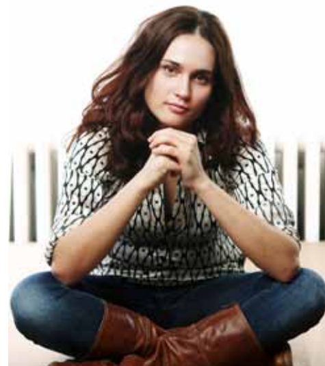
Anna Vinnitskaya

Le profil d'Anna Vinnitskaya pourrait sembler fort banal : études en Russie et en Allemagne, bardée de prix internationaux dès son plus jeune âge, elle se présenta en 2007 au Concours Reine Elisabeth de Belgique qu'elle remporta haut la main. L'histoire nota qu'elle fut seulement la deuxième femme à gagner la prestigieuse compétition belge après sa compatriote Ekaterina Novitskaya (en 1968). Depuis, l'artiste ne cesse de surprendre avec des partis-pris sans concessions comme à l'image de deux disques indispensables consacrés à Rachmaninov-Gubaidulina-Medtner-Prokofiev (Ambrosie) et Maurice Ravel (Naïve). Brillante concertiste, elle est une interprète inégalée du Concerto n°2 de Prokofiev et du Concerto en sol de Ravel.