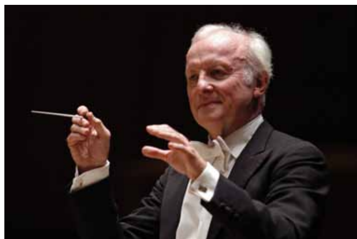
Gerd-Albrecht © YNSO

PAYS France, Provence-Alpes-Côte d'Azur DATES 5/07 ▶ 26/07/2013