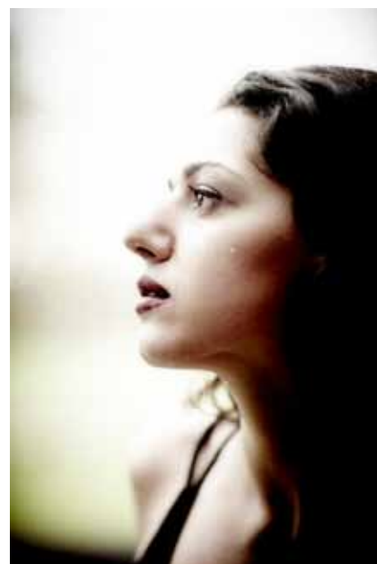
Khatia Buniashtvili